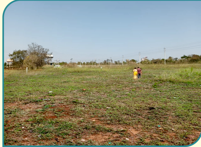
ಉದ್ದೇಶಿತ ಬಡಾವಣೆ / Land for Layout